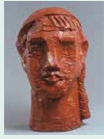
藤野天光「ペレー帽」1926年 館林市蔵