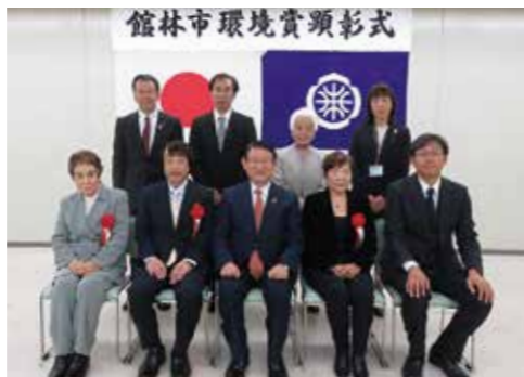
館林市環境賞授賞式

市環境賞の被顕彰者を決定 令和5年度の被顕彰者を決定したのでお知らせします。 受賞者(敬称略) 環境功績賞 環境管理部門 (株)内山製作所 エコアクシヨン21認証継続10年以上 環境功績賞 環境美化部門