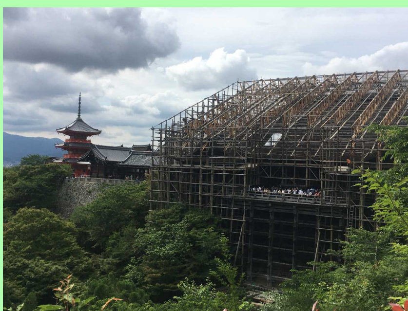
修復が行われている世界遺産・清水寺の本堂