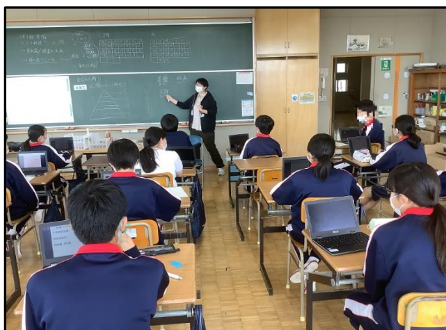
修学旅行前に3年生は仏像の学習を行っています。