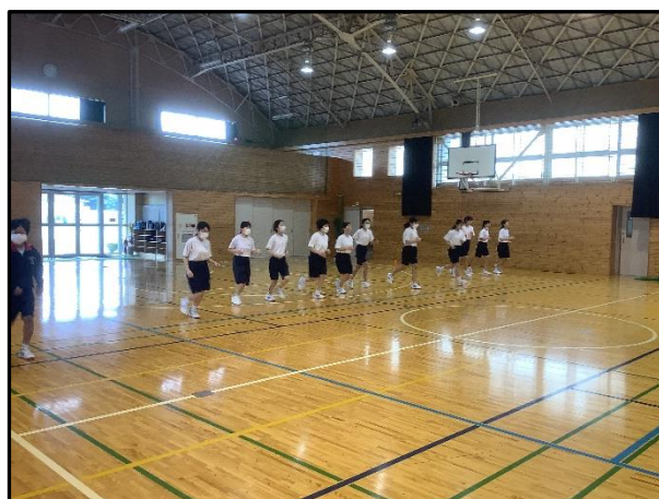
春の名物、新体カテスト シャトルラン。