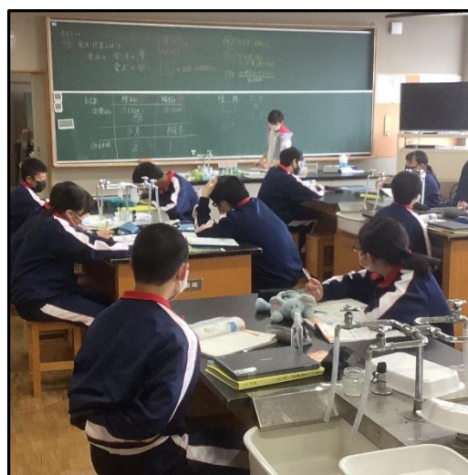
理科の観察学習も始まっています。