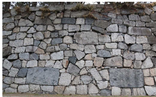
【石垣のような組織】

令和6年度は、『笑顔』『前向き』『感謝』『尊重』をキーワードに、学校の教育目標である「広く豊かな心を持つ」「自ら学ぶ」「心身を鍛える」を目指し、一人一人を大切にしている教育活動を、熱意と活気がある職員たちと、チーム三中として最善を尽くしていきたいと思ひます。また、生徒と職員とで「石垣のような組織」として、様々な個性や石の大きさに関係なく適材適所で互いを支え合える学校づくりを目指します。保護者をはじめとする地域の皆様におかれましては、これまで以上のご支援とご協力をよろしくお願いいたします。