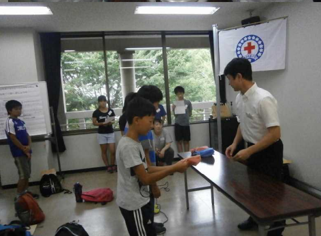
炊き出し体験では、災害時などに用いる炊飯袋（ハイゼックス）で白米を炊きました。