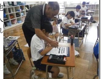
【習字授業支援の様子】