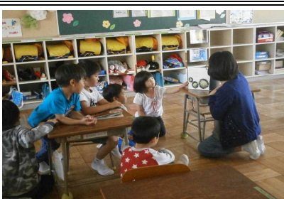
【6年生が1年生に読み聞かせ】

始業前の朝、6年生が1年生の教室で自主的に読み聞かせをしていました。学校内でのボランティア実践です。