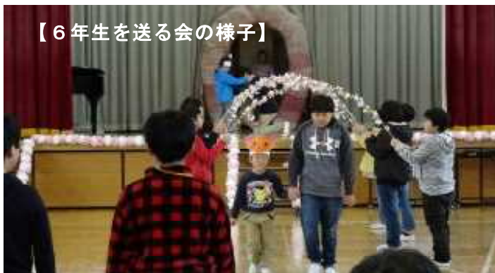
【6年生を送る会の様子】

この一年、本校の子どもたちが様々な場面で、一生懸命な姿、協力し合う姿を見せてくれたことをとてもうれしく思っています。また、この一年間、本校では様々な連携により、授業の充実や豊かな体験、安全な登下校が実現しました。以下が、本校の特色ある教育活動です。【 】はボランティアの協力又は連携先)