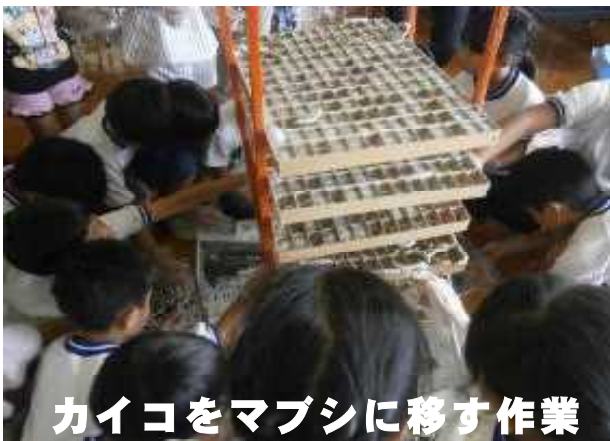
カイコをマブシに移す作業

今年もカイコが順調に育ち、今はマブシ（族）の中で繭になっています。（群馬県庁世界遺産課事業に参加）