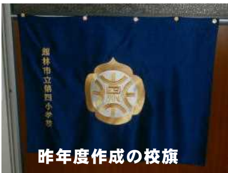
昨年度作成の校旗

（3年生が理科や総合の授業で昆虫の学習を行っていますので、カイコの飼育の中心になっています）