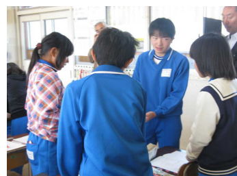
(グループでの話し合い)

1グループ4人で構成されており、話し合っどどの児童も説明できるようになったら着席するように指示した。教師が意図的に算数が得意ではない児童を各グループから一人ずつ計6名を指名したが、苦手な子ほどよく話し合いに参加し、ほとんどがしっかり発表できた。既習の「速さ＝道のり÷時間」を使えば時間も求められるというまとめは出なかったため、教師が助言した。