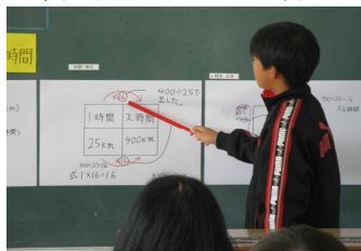
(友達の考えを説明する児童)

自力解決した後にペアで説明し合うことで、自分の考えをより深めたり、違う方法で解いている友達の考えに触れたりする時間をとった。また、発表用カードに書いた児童とは違う児童に解き方を発表させたため、数直線に書き込んである矢印が逆でうまく説明できずに困ってしまう児童や、途中までは説明できたが後が続かない児童も出てきたが、「どうすれば解けるだろう」とみんなで考え、他の児童が後を引き継いで説明することができた。