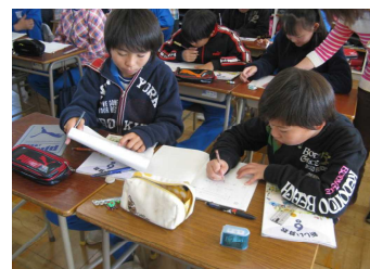
(ペアで説明する活動)

学習課題の答えである「時間を求める方法」をグループで話し合わせ、自分たちで学習のまとめを考えさせた。まとめを導き出しやすいように、5つの発表用カードに書かれた式「 400 \div 25 」には、アンダーラインを引いておいた。