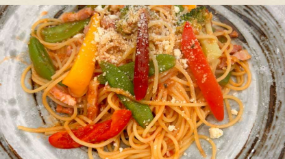
アマトリチャーナ