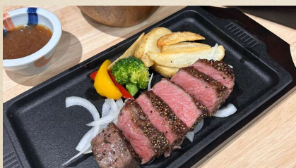
やわらか牛カットステーキ(180g)

デミグラス煮込ハンバーグ ¥1,180 (税込¥1,298) 赤ワインの効いたデミグラスソースで煮込みました