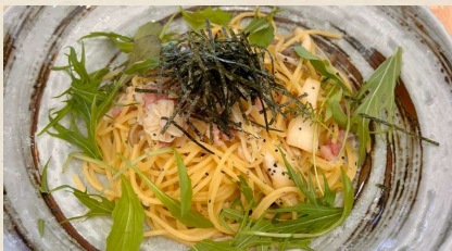
ベーコンとキノコの和風パスタ