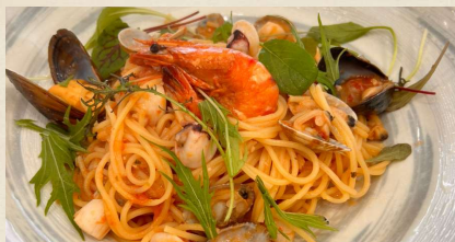
魚介たっぷりペスカトーレ

海老と彩野菜のペペロンチーノ ¥980 (税込¥1,078) ぷりぷり海老にシャキシャキ野菜の塩味パスタ