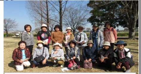
R5つつじが岡公園を楽しくウォーキング