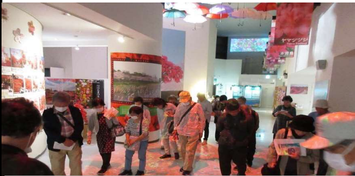
5月17日（金）いきいきわくわく教室（郷谷高齢者教室） 開級式＆つつじ映像学習館鑑賞