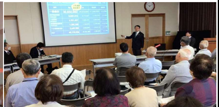
5月25日（土）車座市政報告会（郷谷公民館講堂）