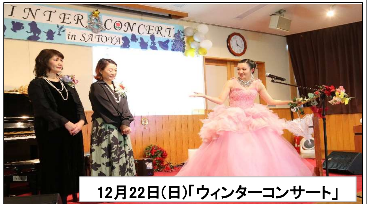
12月22日(日)「ウィンターコンサート」