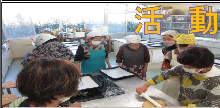
12月2日(月)女性セミナー「シュートーレン作り教室」

◆持参するもの：申告案内ハガキ（届いた方のみ）、本人確認書類（番号確認書類と身元確認書類）、令和6年中の収入が分かるもの、控除を受けるための証明書、通帳、事前に取得した利用者識別番号がわかるもの※用紙や集計方法の案内については1月14日（火）より市役所税務課および各公民館にて配付します。【問合せ】館林市役所 税務課 市民税係 Tel.0276-47-5107（直通）