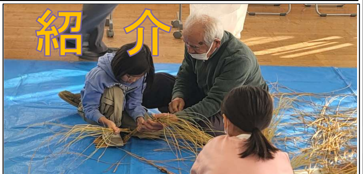
12月21日(土)多世代間交流「しめ縄飾り作り教室」