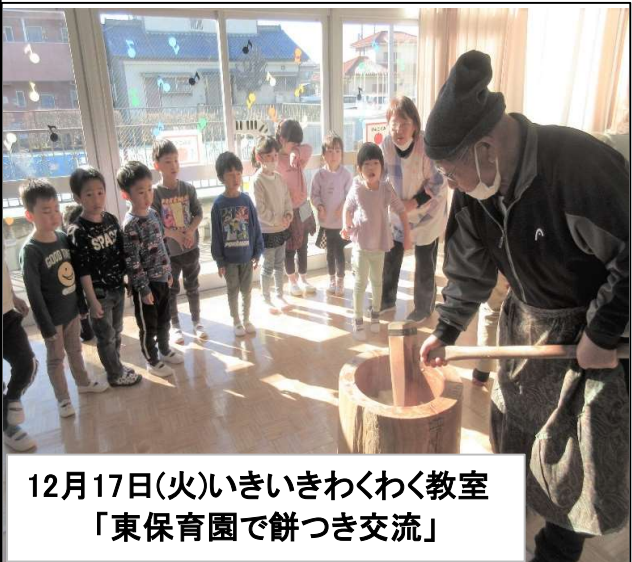
12月17日(火)いきいきわくわく教室 「東保育園で餅つき交流」