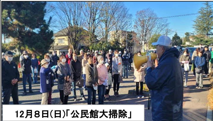
12月8日(日)「公民館大掃除」