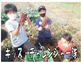
キッズ・チャレンジャー隊