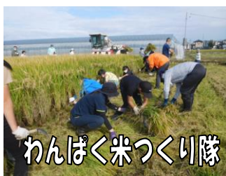
わんぱく米づくり隊