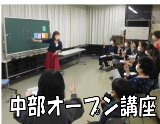
中部オープン講座