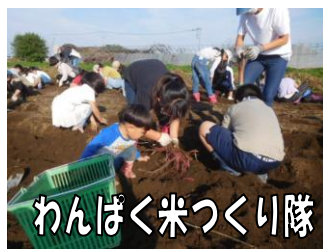
わんぱく米づくり隊