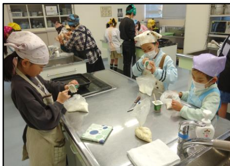
2月14日(土) 六郷少年教室「なんでも体験隊」 (チョコチップブレッドづくり)