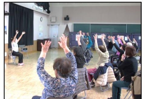
2月24日(火) 六郷おとなカルチャー (座ってできるリンパマッサージ)