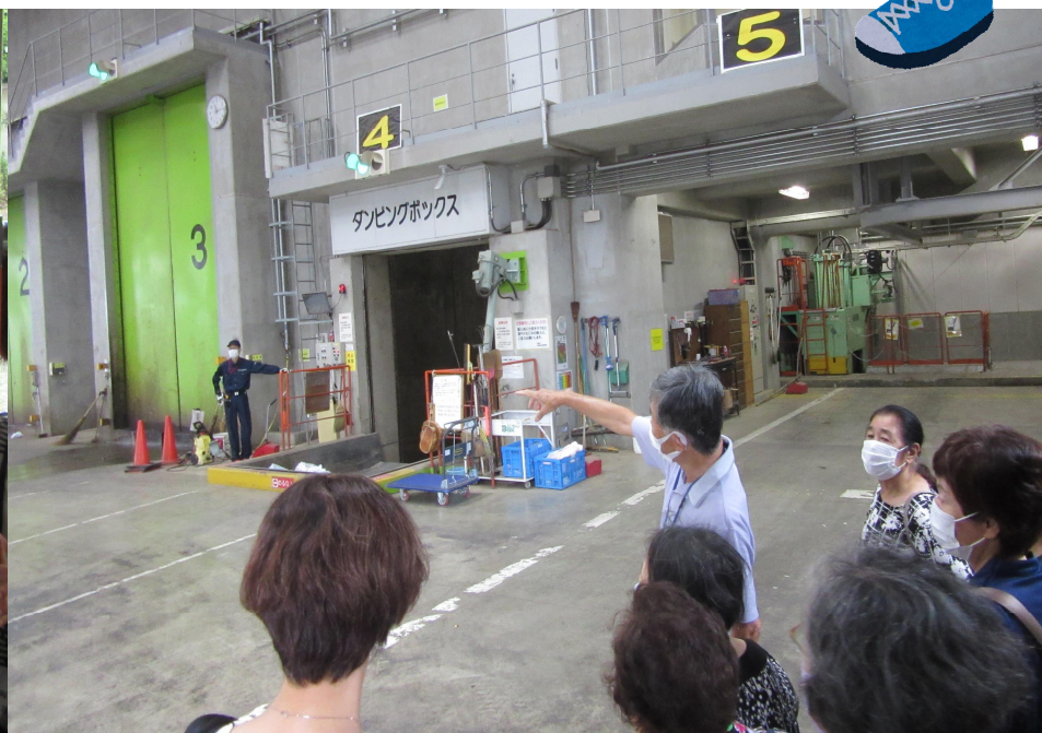
クリーンセンター場内見学