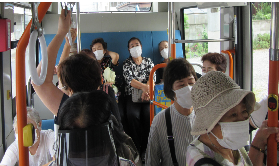
路線バス乗り方について