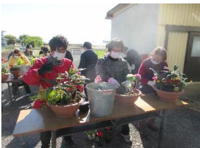
11/18(土) 女性セミナー 「寄せ植え教室」