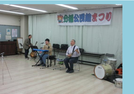
関学和太鼓、ダブルMの演奏をはじめ、たくさんの団体に素晴らしい発表を見せていただきました♪