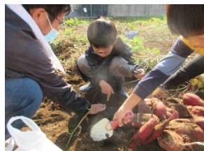
11/3(土) ほんぼクラブ 「さつまいも掘り体験会」