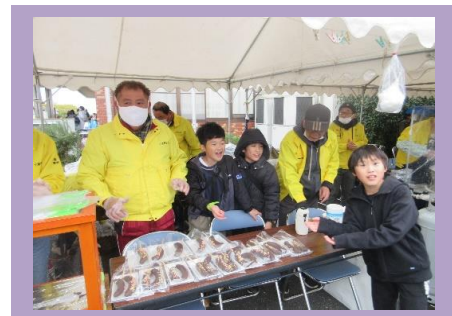
「いろいろな模擬店が並びました♪」