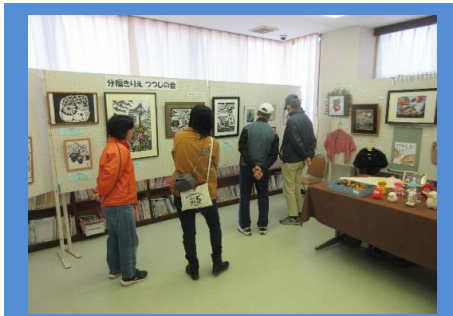
「作品展示」12月3日(日)まで！

11月25日(土)～26日(日)にかけて、「第32回 分福公民館まつり」が開催されました！ 今回は4年ぶりの開催となり、参加団体の皆さんもこれまでの成果を見ていただくため、連日公民館まつりに向けて準備を重ねて参りました！ 2日間でたくさんの来場者があり、盛大に開催することができました♪ 参加団体の皆さん、お越しいただいた皆さん、たくさんの方のご協力ありがとうございました！