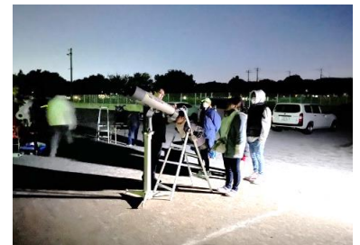
11/18(土) オープン講座 「親子星空観察会」