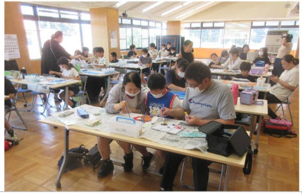
第十小家庭教育学級 夏休み親子ポスター教室