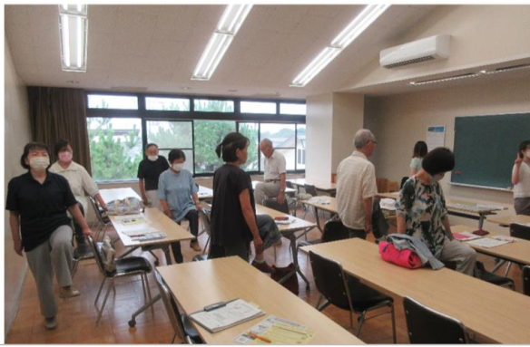
成人講座ふらっと ころとからだの健康づくり