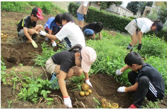
西ダッシュ村 ジャがいも収穫体験