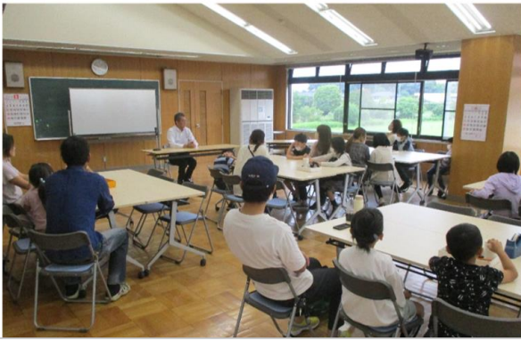
第十小家庭教育学級 開級式