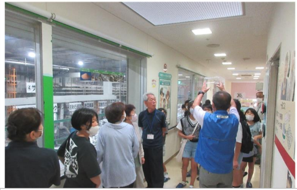
西ダッシュ村 リサイクル工場見学