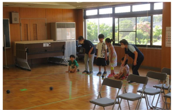
成人講座ふらっと 地域交流ポッチャで遊ぼう