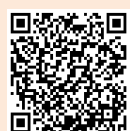
(科学館ホームページQRコード)

最新の情報については、科学館ホームページ( https://www.city.tatebayashi.gunma.jp/kagakukan )をご確認ください。皆さまのご理解とご協力のほど、よろしくお願いいたします。