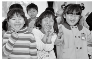
東保育園なわとび大会