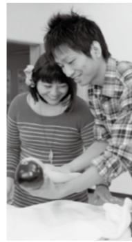
妊娠、出産、育児について

とき 4月26日(金) 午前9時30分～正午 ところ 保健センター 対象 生後5か月～1歳6か月未満の乳幼児と保護者 定員 20組(申し込み多数の場合は初めてのかわり優先) 内容 魚を使った簡単な離乳食の調理実習と試食・交流会 参加費 300円(材料費) 持参する物 母子健康手帳、エプロン、三角巾、子守り帯、子ども用の飲み物、スプーンなど 申込み・問合せ 3月25日(月)から、健康推進課(同センター)内 Tel.74-5155)へ ※調理中は、母子保健推進員が子どもをお預かりします