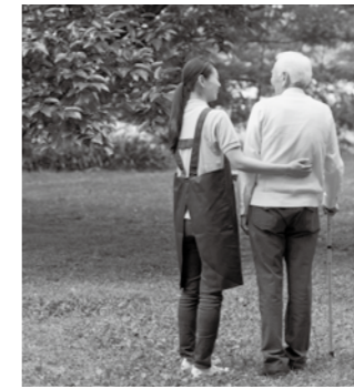
技術や知識を身につける 介護職員初任者研修

定員 20人(先着順) 内容 教養の向上を図り、健康で明るい生活に向けてさまざまな課程を学びます 参加費 無料 申込み 6月10日(月)から、同センター(TEL74-5155)へ 問合せ 同センター、又は介護高齢課高齢政策係(内線621)