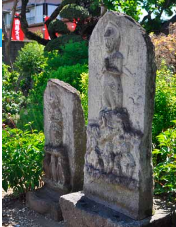
観性寺(仲町)の境内にある江戸時代の庚申塔

道端で見かける石造物は、私たちがとって身近な文化財の一つです。例えば、昭和54年(1979)に刊行された『館林・郷谷の石仏』によれば、旧城下町(館林地区)には、庚申信仰に基づく庚申塔が33基、仏教の信仰から建立されたもので、表面に念仏や題目が刻んである石塔を8基確認できます。庚申信仰は、道教の影響を受けた民間信仰で、庚申の日の夜寝ている間に、体内の虫が天に昇って天帝にその人の過失を告げることを防ぐため、寝ずに過ごすものです。館林地区で年代が最も古い石造物の建立は、庚申塔が寛文8年(1668)、題目の塔が天和3年(1683)、念仏の塔が貞享5年(1688)となっています。大部分