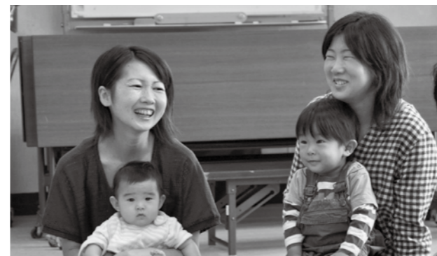
これから生まれてくる赤ちゃんを守るために