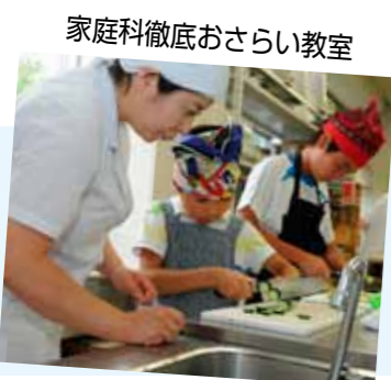
家庭科徹底おさらい教室