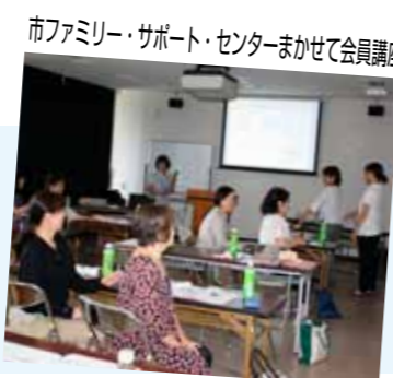
市ファミリー・サポート・センターまかせて会員講座