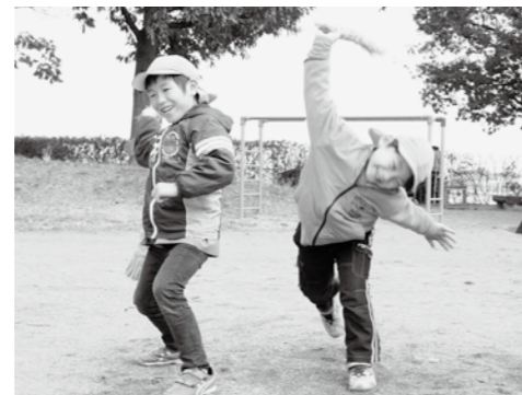
計45点の写真を展示します

平成25年に市内で行われたイベントなど、広報紙に掲載された写真を展示します。 ■とき・ところ ①2月25日(火)〜3月4日(火) 館林つつじの里ショッピングセンターアゼリアロード(楠町) 午前10時〜午後8時 ②3月6日(木)〜14日(金) 館林厚生病院院内ギャラリー 午前7時〜午後7時 ③同 館林東西駅前広場連絡通路 終日 ④3月18日(火)〜28日(金) 市役所市民ホール 午前8時30分〜午後5時15分 ※最終日はいずれも午後3時まで ■問合せ 秘書課広報係(内線343)