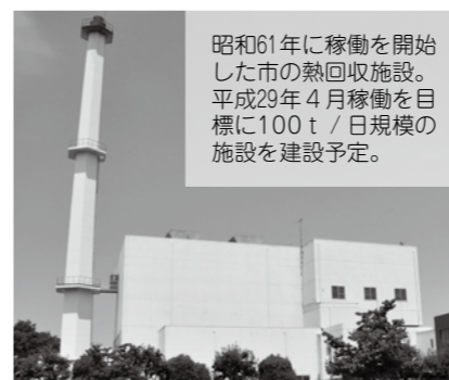
昭和61年に稼働を開始した市の熱回収施設。平成29年4月稼働を目標に100t/日規模の施設を建設予定。