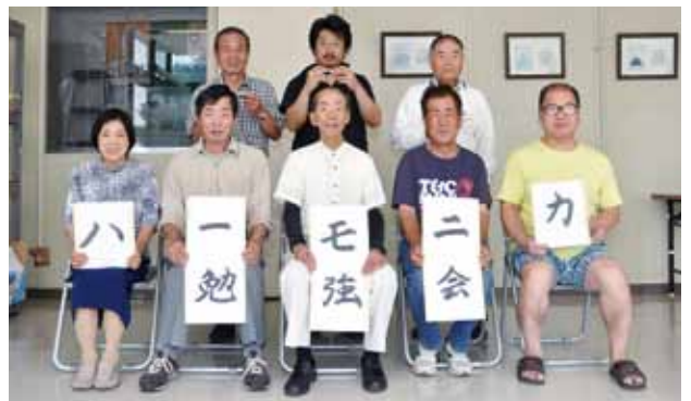
ハーモニカ勉強会