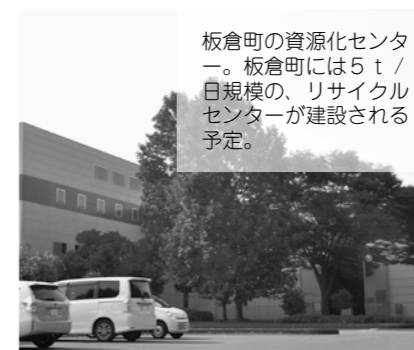
板倉町の資源化センター。板倉町には5t/日規模の、リサイクルセンターが建設される予定。