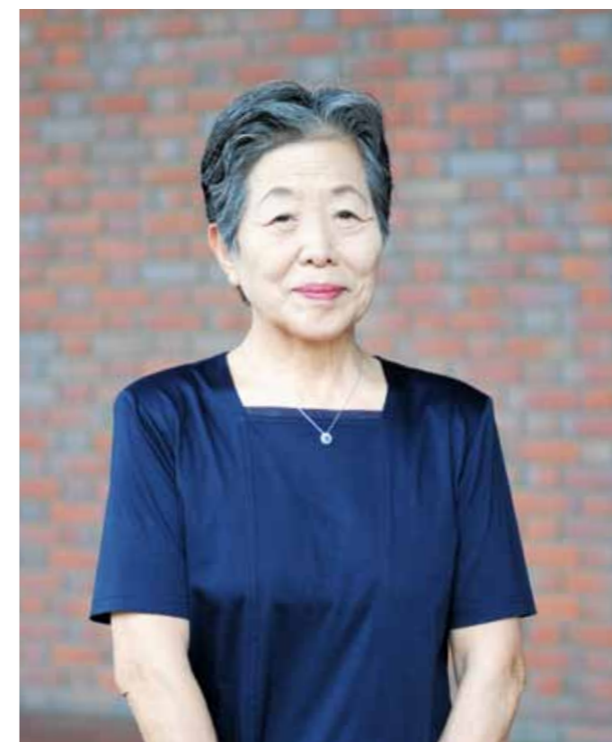
たいせつな人を失う悲しみを繰り返させない