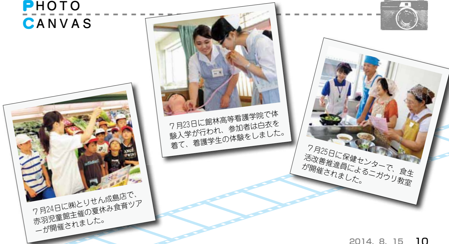
7月23日に館林高等看護学院で体験入学が行われ、参加者は白衣を着て、看護学生の体験をしました。