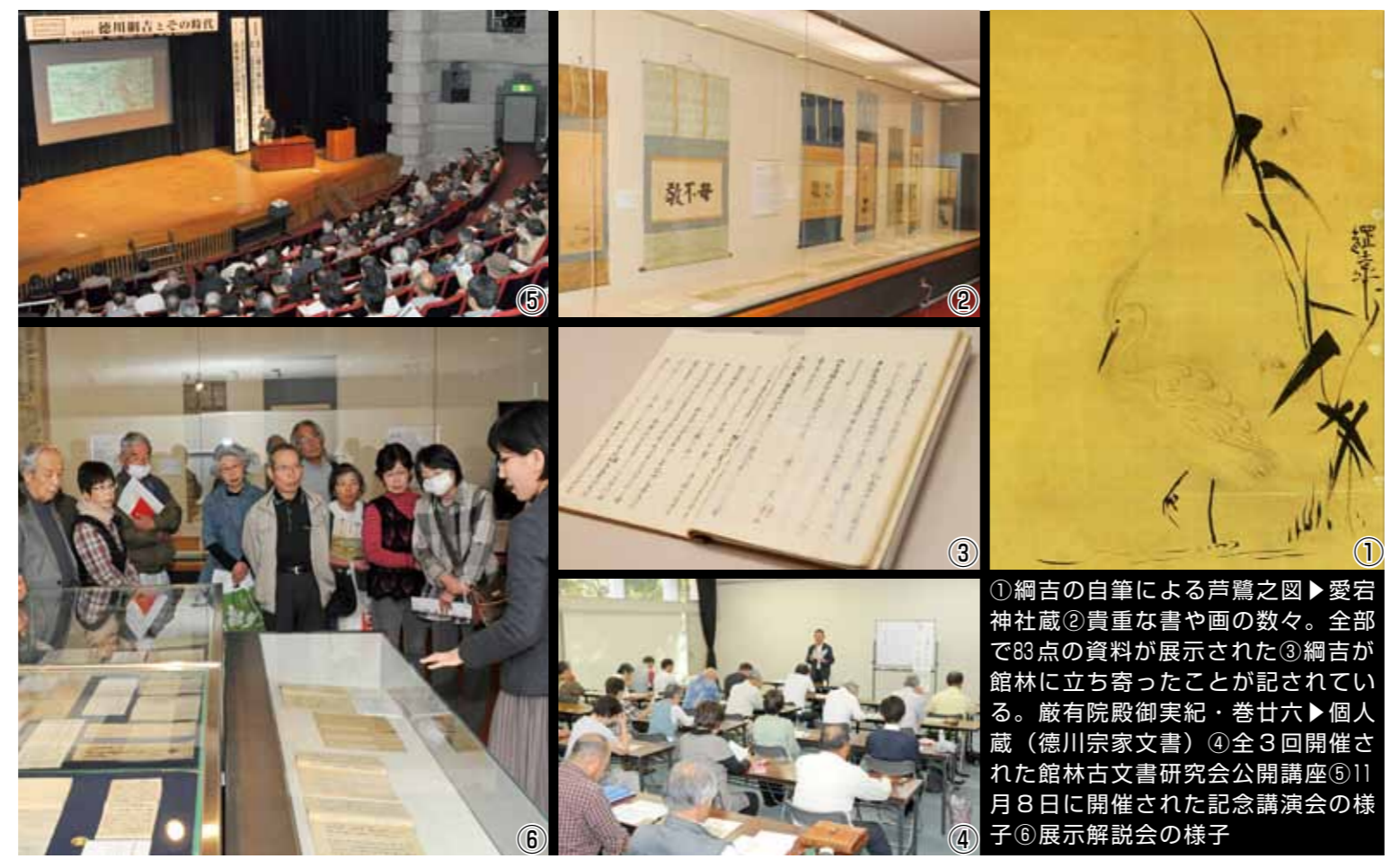
①綱吉の自筆による芦鷺之図▶愛宕神社蔵②貴重な書や画の数々。全部で83点の資料が展示された③綱吉が館林に立ち寄ったことが記されている。厳有院殿御実紀・巻廿六▶個人蔵（徳川宗家文書）④全3回開催された館林古文書研究会公開講座⑤11月8日に開催された記念講演会の様子⑥展示解説会の様子

綱吉の特別展が初開催 11月8日に徳川綱吉とその時代をテーマに開催された記念講演会。そこで徳川宗家の後継者、徳川家広さんは綱吉に対する思いを語りました。「260年続いた江戸時代。初代將軍徳川家康から、100年かけて盤石な体制を築きました。五代將軍の綱吉は、その体制づくりの総仕上げを行った重要人物。今回、ゆかりの地館林市で、綱吉の特別展が開催され、とてもうれしいです」。特別展開催に向けて動き出したの