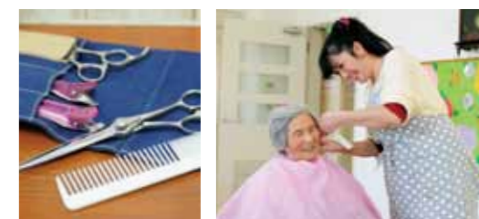
※NPO法人ピュール。ひとり親世帯などの子育てサポートに関わる事業や出張・訪問理美容事業を目的として、今年10月に設立された特定非営利活動法人

profile 平成4年10月、大島町に生まれる。東京国際大学で福祉心理学科を専攻。福祉と心理の両方の視点を学ぶとともに、ゼミで子どもを取り巻く貧困と格差について学ぶ。今年3月に大学卒業を控え、NPO法人ピュールを設立。ピュール理事長。