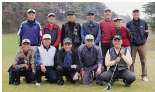
館林シニアゴルフ会