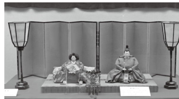
秋元家所用内裏びな・大正時代(館林市立資料館蔵)