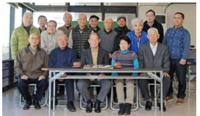
館林中部囲碁クラブ

館林中部囲碁クラブは、毎週金曜日の午後1時から、中部公民館で活動しています。囲碁は、白と黒の碁石を碁盤の上に並べて勝負を決めるゲームです。一見難しそうに見えるかもしれませんが、ルールは簡単なので、子どもからお年寄りまで楽しめます。また、手先を動かすだけでなく、集中力や思考力を高めるので、脳トレーニングにも適しています。