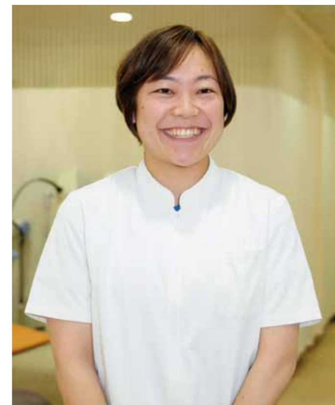
交流を通して成長する子どもたちを応援したい