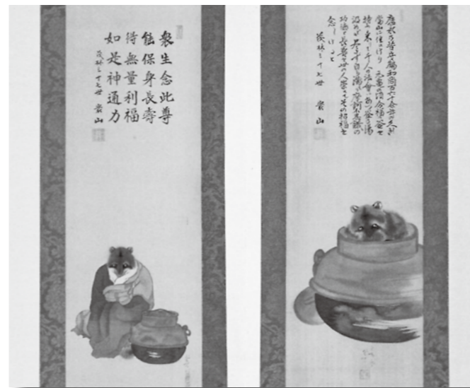
茂林寺に伝わる分福茶釜の掛け軸一对(部分)。茶釜をそばに置く老狸と、茶釜に化ける狸の絵が描かれています

分福茶釜は、いくらお湯をくんでも尽きない不思議な茶釜。江戸後期の根岸鎮衛の著作『耳袋』に「館林の出生の者語りける」で始まる話が載っています。「茂林寺に江湖結齋の時、むかし大衆に茶出すに、煎じ足らず、其頃主たる僧守鶴と言へる、是を拵へさせし由、右守鶴はいつ頃より茂林寺に居けるや知るものなく、老狸のよし申伝へし」とあります。松浦静山の随筆、『甲子夜話』