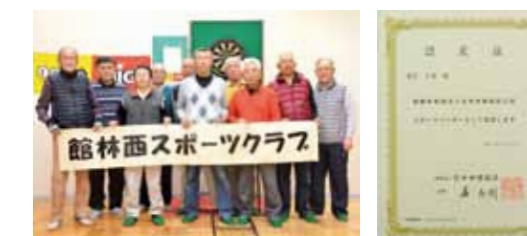
※総合型地域スポーツクラブは、誰もがやりたいスポーツ（文化活動を含む）を自由に選択でき、各種イベントなどいろいろな形で楽しむことのできる場

profile 昭和13年1月、東京都文京区に生まれ、小学生のときに館林市に移住。定年後、総合型地域スポーツクラブの立ち上げを勧められ、地域で仲間の輪を広げながらクラブを法人格に。趣味はゴルフ。NPO法人館林西スポーツクラブ副理事長。