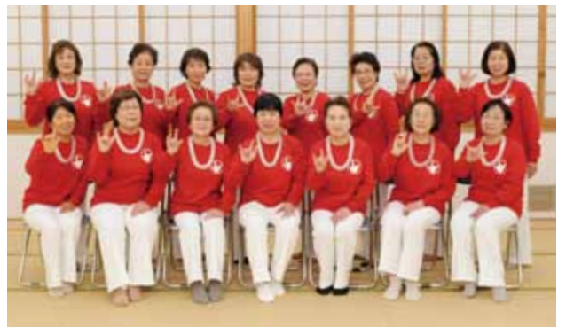
手話ダンスクラブ多々良