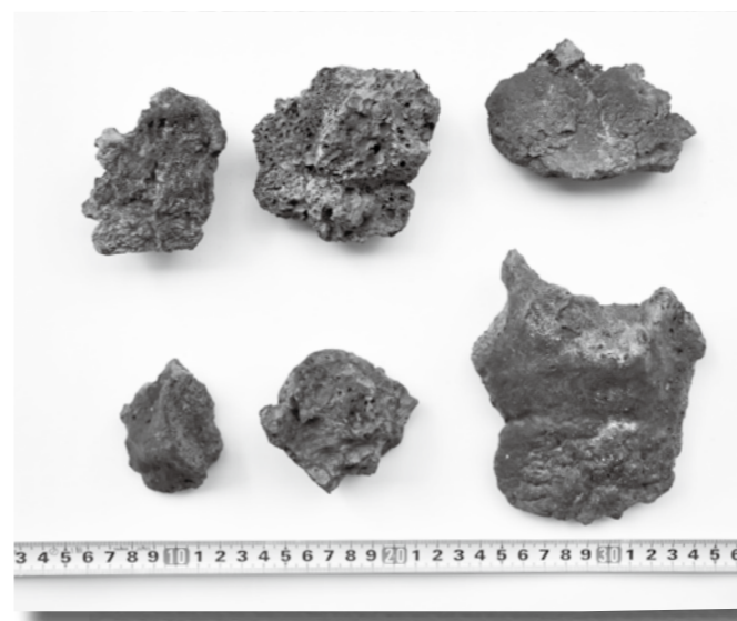
多々良沼から採取した鉄滓の一部。たたら製鉄の歴史を伝えます

多々良の地名の由来がたたら(踏鞴)製鉄であることはご存じのことと思います。多々良沼の北岸の浅瀬では、水が少なくなる冬場に鉄の塊のようなものが拾えることがあります。これは鉄滓や金糞と呼ばれ、製鉄の過程で出る鉄の不純物です。たたら製鉄とは粘土で作った炉の中に木炭と砂鉄を入れ、三日三晩火を燃やして鉄を作る日本古来の製鉄法で、製作途中で砂鉄に含まれる不純物が溶け、