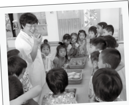
9月3日、ファイブ・ア・デイ(食育講座)が美園保育園で行われました。年長児19人は、買い物ゲームなどを通して、食べ物の特徴や食事のたいせつさを学びました。