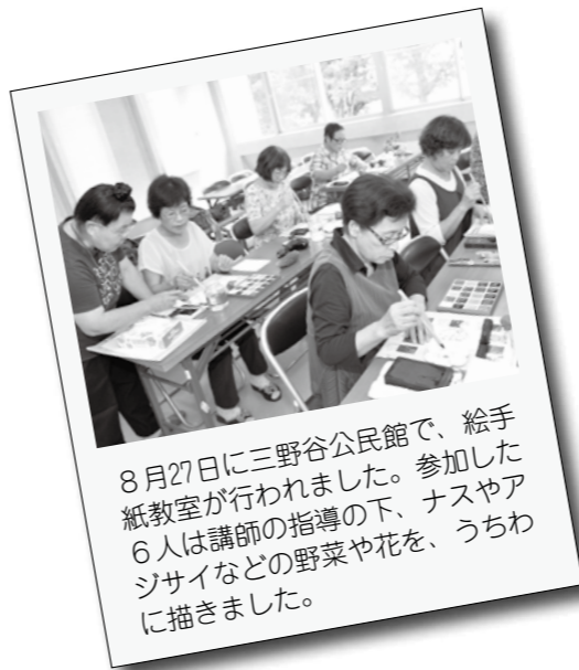
8月27日に三野谷公民館で、絵手紙教室が行われました。参加した6人は講師の指導の下、ナスやアジサイなどの野菜や花を、うちわに描きました。