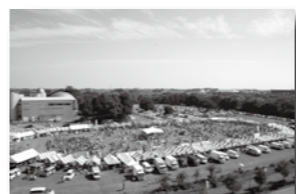
昨年を上回る数の来場者でにぎわう会場の様子