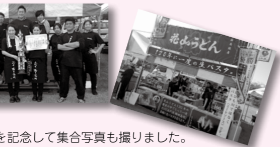
当日の様子。優勝を記念して集合写真も撮りました。

◆優勝と聞いたときの気持ちは？ まさか優勝するとは思っていませんでした。名前を呼ばれたときはびっくりしました。お客さんがおいしいと評価してくれたことが、今回の結果につながったので、とてもうれしいです。