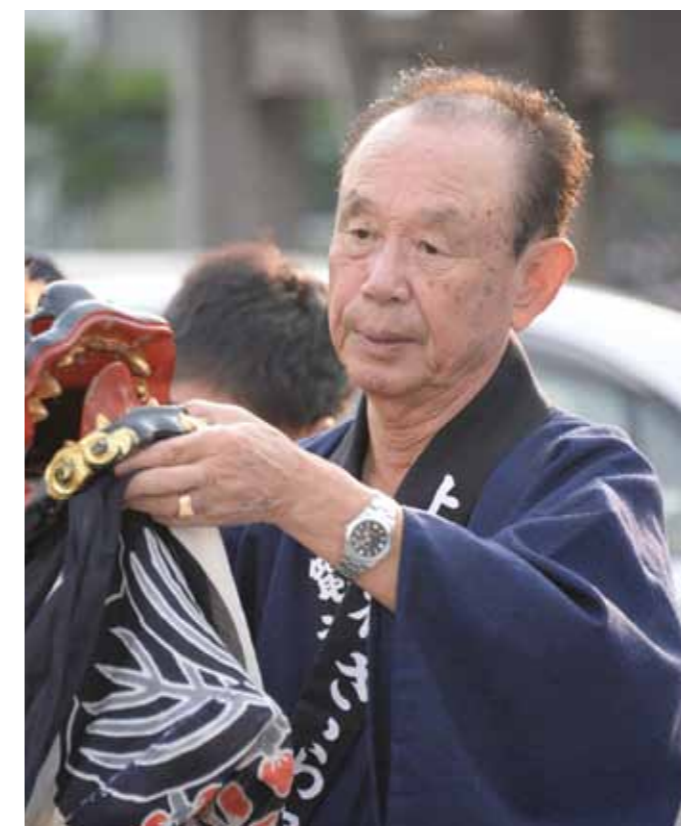
地域の伝統行事を次世代にしっかり残したい