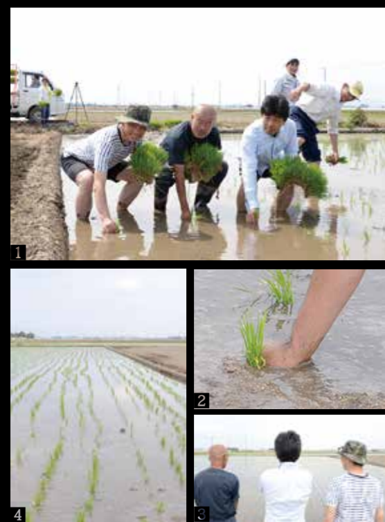
①酒米の田植えの様子。今回は6反のたんぼから収穫される酒米を使い、1.8ℓ換算で約1500本の日本酒を製造する予定 / ②群馬県の酒造好適米「舞風」③田植え後にたんぼを見つめ、今後の計画を話す3人 / ④「手植えした場所は苗の列が乱れている」との指摘に、たんぼは笑いに包まれた