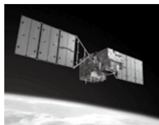
温室効果ガス観測技術衛星「いぶき」

申込み・問合せ 7月9日(出)の午前9時から、同館 (Tel.75-1515) へ