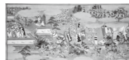
大坂夏役最上屏風摹写図