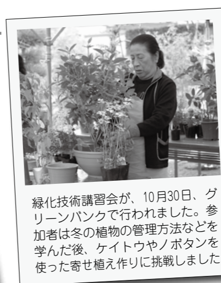
緑化技術講習会が、10月30日、グリーンバンクで行われました。参加者は冬の植物の管理方法などを学んだ後、ケイトウやノボタンを使った寄せ植え作りに挑戦しました。