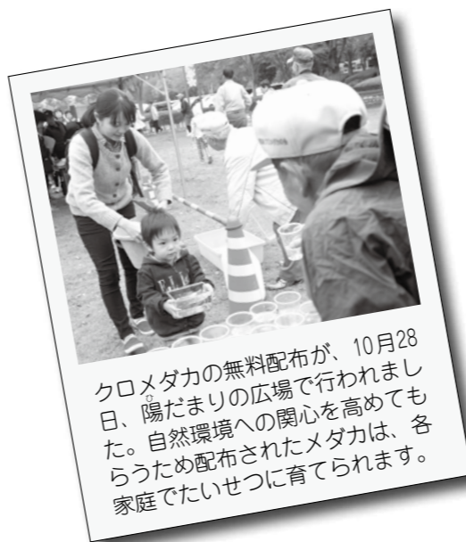
クロメダカの無料配布が、10月28日、陽だまりの広場で行われました。自然環境への関心を高めてもらうため配布されたメダカは、各家庭でたいせつに育てられます。