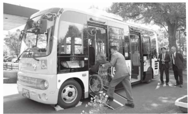
車椅子での乗降も可能です

館林・板倉北線のバス車両が新しくなりました。新車両は、高齢者や障がい者も利用しやすいバリアフリー化されたノンステップバスで、環境にも優しい車両です。新車両は11月1日から運行していただきますので、お出かけのときはぜひご利用ください。