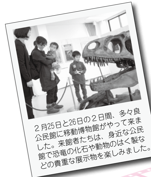
2月25日と26日の2日間、多々良公民館に移動博物館がやって来ました。来館者たちは、身近な公民館で恐竜の化石や動物のはく製などの貴重な展示物を楽しみました。