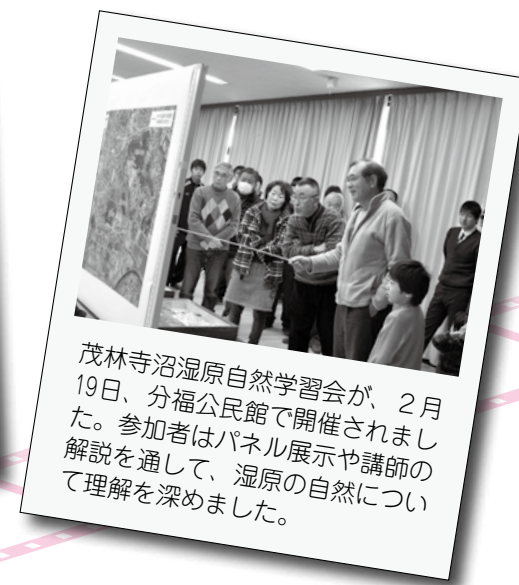
茂林寺沼湿原自然学習会が、2月19日、分福公民館で開催されました。参加者はパネル展示や講師の解説を通して、湿原の自然について理解を深めました。