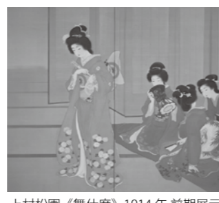
上村松園《舞仕度》1914年前期展示

の午前9時から、電話で同センター(☎ 75-7111)へ とき 6月25日(日)まで 午前9時30分〜午後5時(入館は4時30分まで) ※月曜日(5月1日)を除く、5月23日(火)は休館