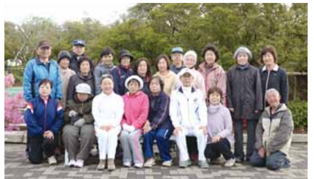
花山シニアクラブ