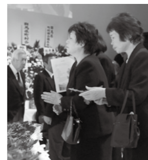
▶ 献花をする参列者たち