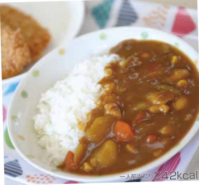
常楽幼稚園の人気定番メニュー。具材の風味を生かして辛さ控え目に仕上げた一品。

野菜たっぷりのカレーで、子どもたちに大人気の一品です。サツマイモやスイートコーンを入れることでより甘口になり、食べやすくなります。ぜひお試しください。