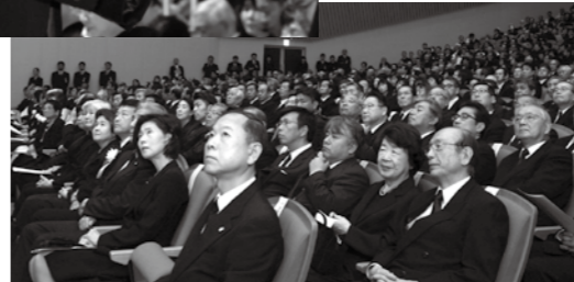
▼ ありし日の安楽岡 前市長の姿を心に 刻む参列者たち