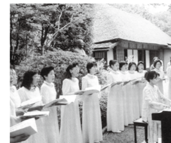
前回のコンサートの様子