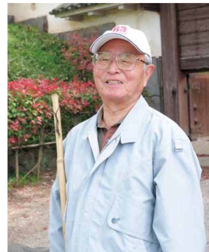
地域の素晴らしい活動を後世につなぎたい