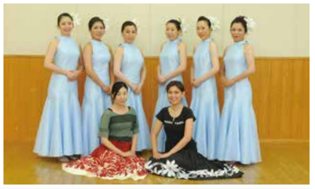
ライヌイ・タヒチ