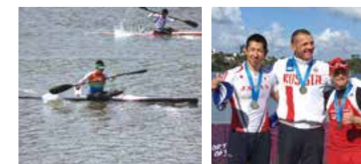
レースで力漕する石毛選手(写真左)と、4年に一度開催されるワールドマスターズゲームズで銀メダルを獲得したときのメダルセレモニー(写真右)

昭和56年7月、堀工町に生まれる。高校からカヌーを始め、国内外の大会などで活躍する。社会人になってからも日本選手権で優勝したほか、日本代表として各種大会に参戦。ワールドカップ6位に入賞するなど、数々の成績を残している。