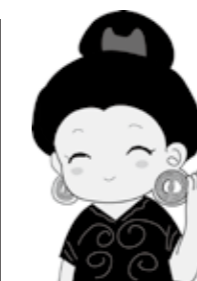
イメージイラスト