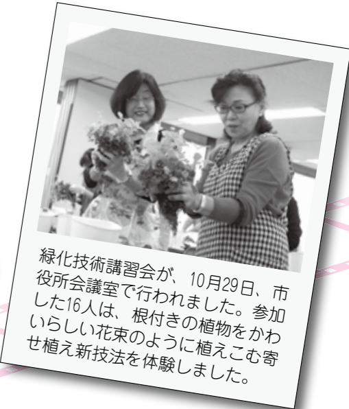
緑化技術講習会が、10月29日、市役所会議室で行われました。参加した16人は、根付きの植物をかわいらしい花束のように植えこむ寄せ植え新技法を体験しました。