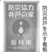
防災井戸を示す看板

現在、市ではコカコーラやカルピス、サントリー、ダイドー、伊藤園の5社と飲料水に関する協定を、とりせんや農協、コープぐんまと食料品を含む応急生活物資の供給に関する協定を締結。今後も、市民の皆さんが安心して生活を送れるような体制づくりを進めていきます。