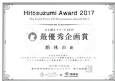
最優秀企画賞賞状