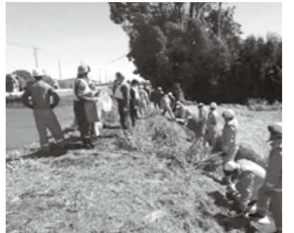
新堀川の堤防からの漏水に対して、応急措置を施す消防・水防団

一方、市内上三林町を流れる新堀川では、大雨により河川の水位が増し、堤防からの漏水が確認されたため、消防・水防団により、応急措置が施されました。これに伴い、同23日には、三野谷公民館を自主避難所として開設し、近隣住民に自主避難を呼びかけました。今後も正確ですばやい対応と情報発信に努めるとともに、市民生活の安全確保を行っていきます。