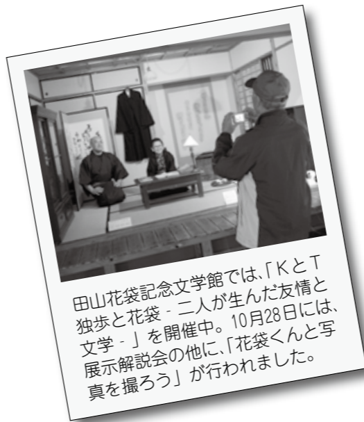
田山花袋記念文学館では、「KとT 独歩と花袋 - 二人が生んだ友情と文学 -」を開催中。10月28日には、展示解説会の他に、「花袋くんと写真を撮ろう」が行われました。