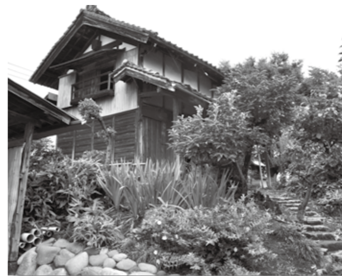
大島町内に残る水塚