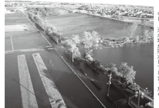
台風21号により、冠水した近藤沼周辺。もし、浄水場が冠水してしまったら...

先月22日から23日にかけて、台風21号の影響で、館林市内も停電や倒木、床下浸水、河川漏水、道路冠水などの被害が発生しました。自主避難所も開設され、近年発生する天災のリスクを改めて痛感させられました。もし更に大きな規模の降雨だったら、もし市内の浄水場などが冠水してしまったら、どうなっていたのでしょうか。