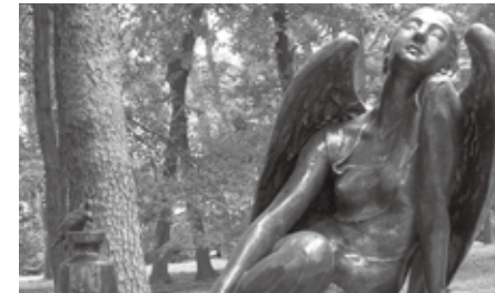
(上)「夢」(1934年制作)1992年「彫刻の小径」設置/(左)「光は大空より」(1965年制作)1979年文化会館西側設置