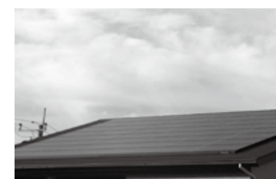
10kW以上の太陽光発電設備は償却資産の申告対象です(写真:住宅の屋根置き型太陽光パネル)

たは必要ありません 申告期限 同30年1月10日(水) 申告先・問合せ 住宅用地に関する申告書(税務課及び市ホームページにあります)を直接、又は郵送で同資産税係(〒374-8501 市役所内 内線609)へ