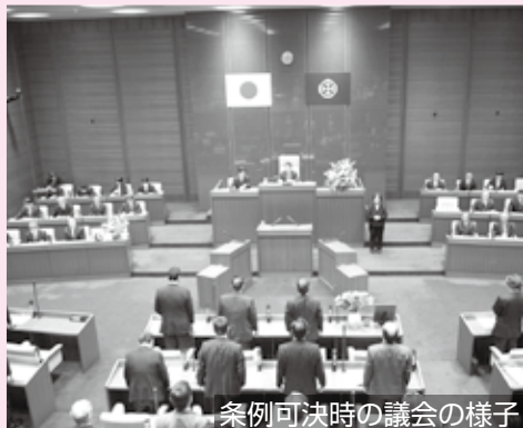
条例可決時の議会の様子