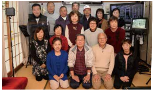
三野谷カラオケ愛好会