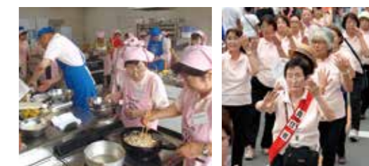
地域に広めるための事前勉強を行うリーダー研修(写真左)と、活動の普及などを目的に館林まつりの民謡流しにも参加する食改推メンバー(写真右)

profile 昭和20年3月、茨城県境町に生まれる。現在、食改推の活動の他、高齢者への会食サービスを月1回行う。活動的でさまざまな趣味の持ち主。今は毎週太極拳で体を動かすほか、スポーツ吹き矢を楽しむ。城沼公民館の女性セミナー学級長。