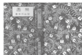
『楽園』8版 装幀者不明 大正2年発表作品の改装版