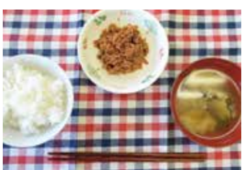
ご飯 (レトルト)、みそ汁、まぐろフレーク (缶)