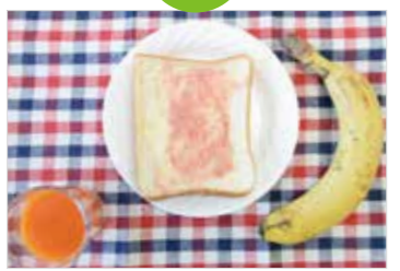
パン (ジャム)、野菜ジュース、バナナ