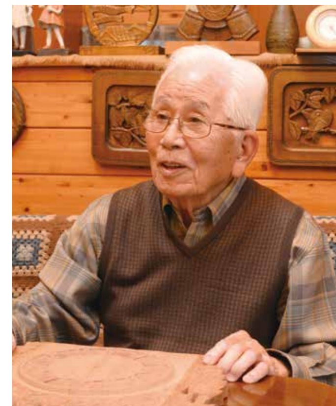
仲間たちといっしょに元気に毎日を楽しみたい