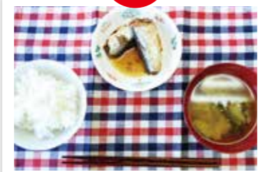
ご飯 (アルファ米)、みそ汁、いわしの煮付け (缶)