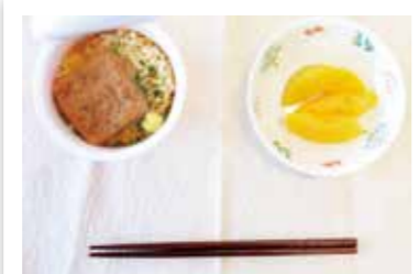
きつねうどん (カップ麺)、フルーツ缶 (桃)