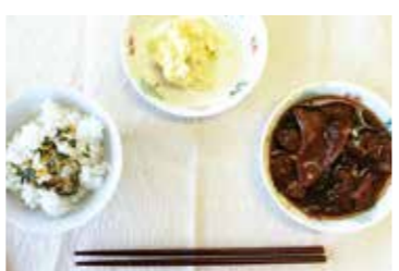
ご飯 (レトルト)、ふりかけ、牛筋煮込み (缶)、ポテトサラダ (缶)