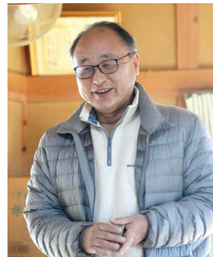
かるたを通じて子どもたちの成長に関わりたい