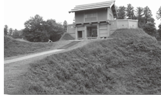
井伊直政が改修した箕輪城(高崎市)

館林城三の丸から城外へ向かい千貫門から堀を渡った所に、「丸戸張」という出入り口の施設がありました。近世前期館林城では、丸戸張は堀に囲まれ、内側に土塁を巡らせた複雑な形態をしていました。宝永5年(1708)から越智松平氏によって再築された近世後期館林城では、外郭の一角に含まれ、城内でも重要な出入り口であり、大手口として丸戸張門外で下馬、丸戸張門内で下乗と決められて