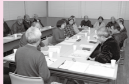
情報交換会で地域の困りごとなどについて話し合った郷谷地区