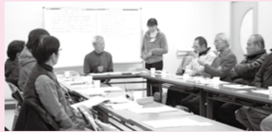
2月1日に第2層協議体を立ち上げた渡瀬地区