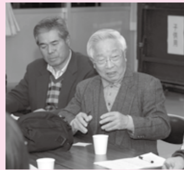
隣近所の課題などを話し合った 三野谷地区の情報交換会