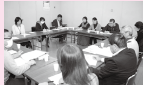
システム構築に向けて話し合う第1層協議体(市ささえあい地域づくり協議体)

高齢者たちが住み慣れたまちで安心して暮らせるよう、よりよい地域づくりのお手伝いをしたいと思い、活動に参加しています。