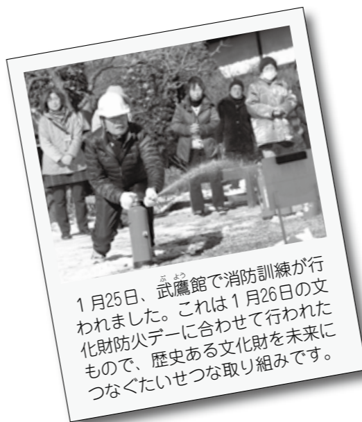
1月25日、武鷹館で消防訓練が行われました。これは1月26日の文化財防火デーに合わせて行われたもので、歴史ある文化財を未来につなぐたいせつな取り組みです。