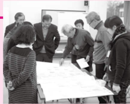
昨年9月、一足先に第2層協議体として 動き出した多々良地区