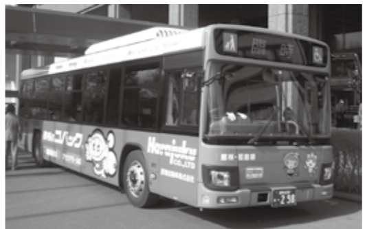
フロント部分にぼんちゃん、いたくらのペイントがあります

館林・板倉線のバス車両が新しくなりました。旧車両では乗車定員が70人でしたが、新車両では国内で生産される最大の車長のものを使用し、定員87人まで乗車することが可能になりました。また、高齢者や障がい者も利用しやすいバリアフリー化された大型ノンストップバスで、走行時の騒音や振動も少なく、環境にも優しい車両です。お出かけの際は、新しくなったバスをぜひご利用ください。