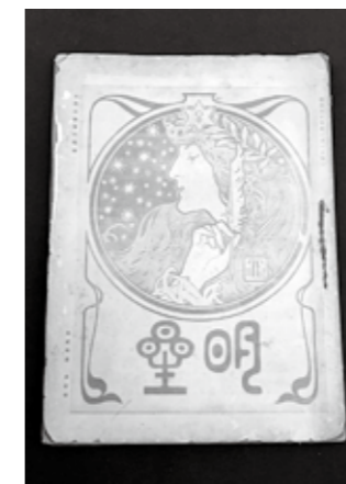
「明星」2巻1号(明治35年 1月発行)

文学館では現在、『田舎教師』展を開催しています。 主人公・林清三のモデル小林秀三は、当時の雑誌 や小説など多くの書物を読んでいました。中でも最 も愛読したのが、明治 33年(1900)に与謝野 鉄幹が創刊した雑誌「明 星」です。浪漫主義的 な新しい作風で一世を 風靡した「明星」は、 当時の青年の憧れの雑 誌でした。花袋も「明 星」の影響を受けてお り、作中でも清三が熱 心に「明星」を読みこ む場面を登場させてい ます。 期間 5月27日(日)まで