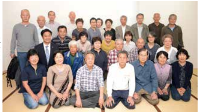
館林ハイキングクラブ