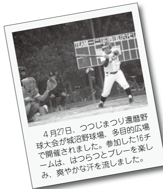
4月27日、つつじまつり遷野野球大会が城沼野球場、多目的広場で開催されました。参加した16チームは、はつらつとプレーを楽しみ、爽やかな汗を流しました。