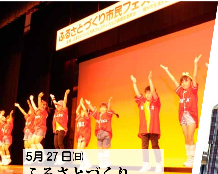
5月27日(日) ふるさとづくり 市民フェスティバル