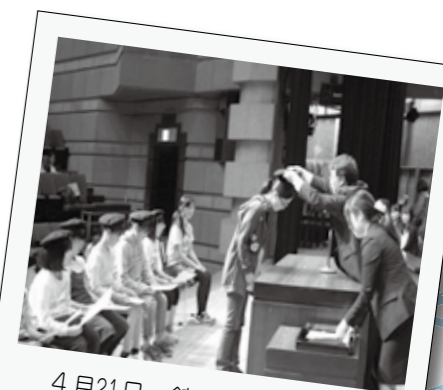
4月21日、館林市青少年少女合唱団の入団式が三の丸芸術ホールで行われました。新たに入団した10人は団員証の交付とベレー帽を授けられました。