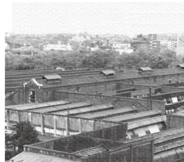
「館林城ゆめひろば」にあった明治・大正時代の鋸屋根の工場群 (平成5年撮影)

このたび市役所東広場の愛称が「館林城ゆめひろば」と決まりました。この場所は、江戸時代は館林城二の丸や南郭となっていたところですが、平成5年(1993)までレンガ造や石造の鋸屋根が連なる大きな工場建物群があったことを覚えていらっしゃる方多いのではないのでしょうか。これらの建物は、明治43年(1910)に建設された上毛モスリン(株)の工場建物群でした。上毛モスリンは毛織物の工場として