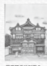
恩田昭氏淡彩画の一つ

申込み・問合せ 市史編さんセンター 1(第二資料館内) Tel.76-176 51 〓shisihensan@city.tatebayashi-gunma.jp