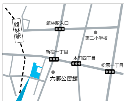
☎学校給食センター (TEL73-2160)

新センターの構造は、給食調理の一連の流れが一通り見学できるようになっており、どのように給食が作られて学校まで運ばれるのかを分かりやすく学べます。さらに、センター内には食育活動のための調理実習室や研修室を整備。今後は親子料理教室など、児童・生徒へ利活用を進めていきます。