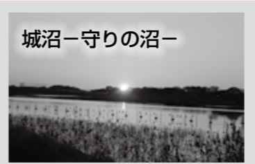
城沼は龍神伝説が残る神聖な沼で、天然の要害として館林城の守りを固め、つつじが岡では400年間古木が守られてきた

客が季節性にとらわれず、市内を回遊できる仕組みになっています。 今回の日本遺産申請を契機に、今後は、沼や沼辺文化を生かした新しいまちづくりに向けた事業を展開していく予定。「沼辺」と「イノベーション（革新）」を合わせた造語「ヌマベーション」を合言葉に、人や組織の新しいネットワークを構築し、カヌー、カヤックなど、さまざまな試みを視野に入れながら動き出します。申請の結果は5月下旬に文化庁より発表されます。館林地域の暮らしに深く関わり、親しまれ、郷土の誇りである「里沼」のたどってきた歴史を改めて、内外に広めていきたいと思います。