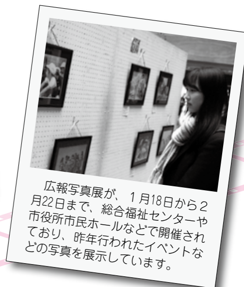
広報写真展が、1月18日から2月22日まで、総合福祉センターや市役所市民ホールなどで開催されており、昨年行われたイベントなどの写真を展示しています。