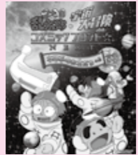
© 尼子騷兵衛 / NHK・NEP NASA / JHUAPL/SWRI

期間 3月2日(出)〜土・日曜日、祝日 時間 午前10時、午後1時(約30分) ※投影日時については事前に向井千秋記念子ども科学館ホームページをご覧ください