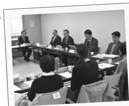
障がい者就労支援座談会が、1月24日に館林文化会館で開催され、障がい者雇用に関心のある企業と障がいのある子の保護者が、意見交換をし、理解を深めました。