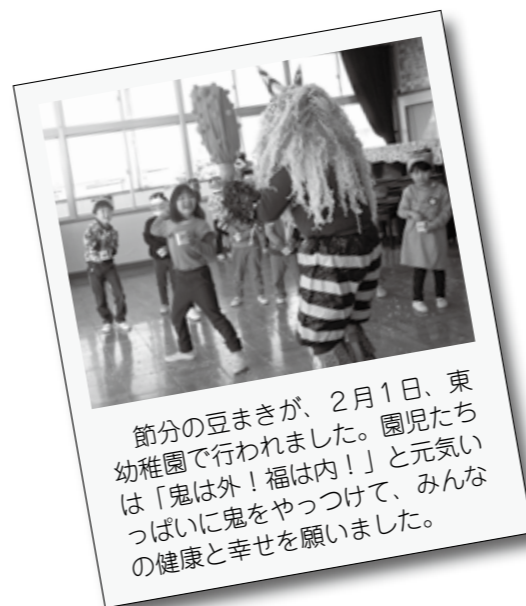
節分の豆まきが、2月1日、東幼稚園で行われました。園児たちは「鬼は外!福は内!」と元気いっぱいに鬼をやっつけて、みんなの健康と幸せを願いました。