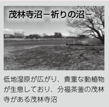
低地湿原が広がり、貴重な動植物が生息しており、分福茶釜の茂林寺がある茂林寺沼

山」にちなみ「里沼（SATO・NUMA）」としてストーリー化しました。 また、日本遺産ストーリーの中に、つつじが岡や大谷休泊の墓、川魚を食べる食文化、旧秋元別邸など、沼との関わりが深い文化財なども組み込みました。国内外からの観光