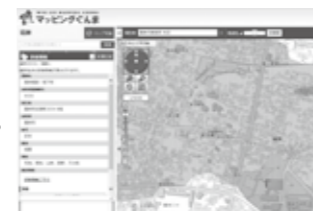
「マッピングぐんま」の画面

埋蔵文化財の範囲であることは、その当時の生活に適した場所であった証拠の一つです。この機会に、足もとに眠る文化財にも目を向けてみませんか。