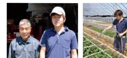
作業を共にしているおじいさんからは豊富な知識や経験を日々引き継いでいる(写真左)。1日おきに行う水やりは、苗が倒れないように注意が必要(写真右)

profile 平成9年4月、上三林町に生まれる。平成30年度の館林市新規農業後継者として認定された。車の整備の仕事から一転、平成29年から就農。テレビで北海道の番組を見て心が決まった。休日に友達と集まって話をするのが楽しみ。