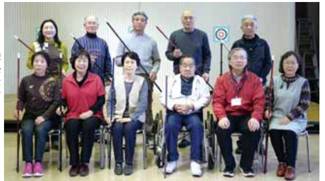
館林SW吹矢クラブ赤羽