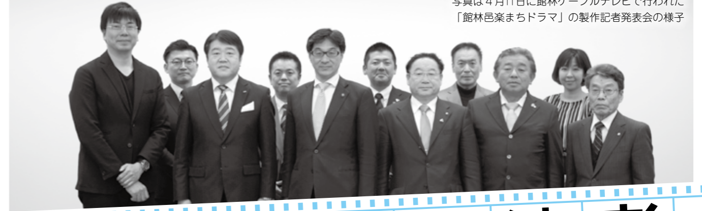
写真は4月11日に館林ケーブルテレビで行われた「館林邑楽まちドラマ」の製作記者発表会の様子