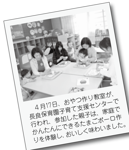
4月17日、おやつ作り教室が、長良保育園子育て支援センターで行われ、参加した親子は、家庭でかんたんにできるたまごボーロ作りを体験し、おいしく味わいました。