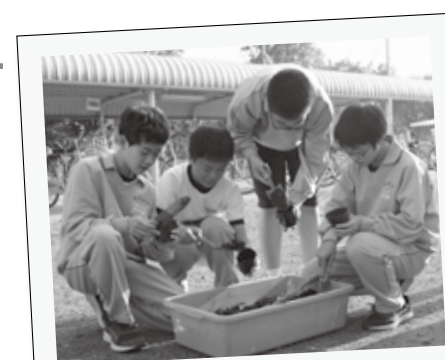
4月23日、第四中学校で貴重な植物であるオニバスの種まきが行われました。苗が成長したら保護池に移される予定で、生徒たちがたいせつに育てていきます。