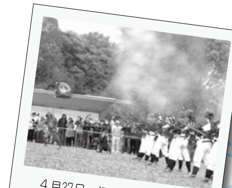
4月27日、江戸幕府鉄砲組百人隊出陣が、つつしが岡公園内大芝生広場で行われました。鎧兜に身を包んだ鉄砲組が一斉射撃すると、来場者から拍手が送られました。