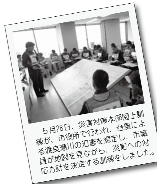
5月28日、災害対策本部図上訓練が、市役所で行われ、台風による渡良瀬川の氾濫を想定し、市職員が地図を見ながら、災害への対応方針を決定する訓練をしました。