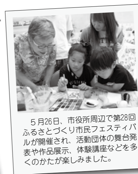
5月26日、市役所周辺で第28回ふるさとづくり市民フェスティバルが開催され、活動団体の舞台発表や作品展示、体験講座などを多くのかたが楽しみました。