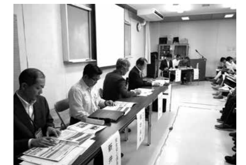
当日、たくさんの住民が集まった会場は満杯に。市長やパネリストと住民の間で熱い意見が交わされました