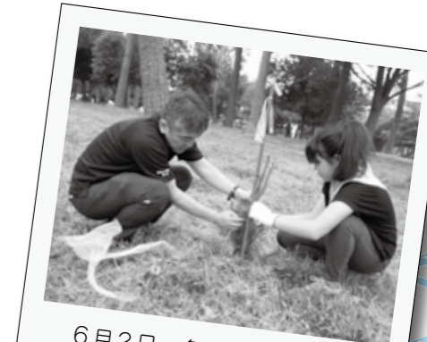
6月2日、多々良アカマツ植樹体験事業が、多々良保安林で行われました。参加者は、松くい虫や保安林、植樹方法について学んだ後、協力し合って植樹を行いました。