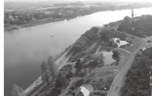
日本遺産の「里沼」の一つとなった城沼 (手前がつつじが岡公園)

館林市内には日本遺産認定の目玉となった城沼、多々良沼、茂林寺沼のほかにも近藤沼と蛇沼があります。自然にできた沼が5つもある都市は関東平野でも珍しく、県内では本市だけでもこれだけの沼は漁業や掘上田灌漑用水源あるいは萱場として地域を支え、その水辺景観が「水と緑の館林」を作っています。今回、日本遺産に認定となった「里沼」は、自然と人間が共生して環境が保たれてきた「里山」になぞらえて作られた言葉です。